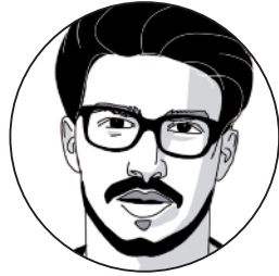
WIWI'S & DIGITAL BUSINESS EXPERTS